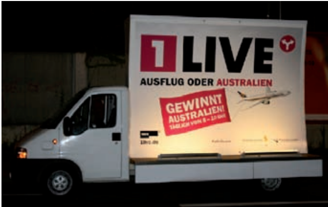
Format: 356 x 252 mm

Le film adhésif est un support publicitaire apprécié aussi bien en intérieur qu'en extérieur. Il est tout particulièrement utilisé comme affichage latéral sur les bus, comme format 18/1 sur les panneaux publicitaires, comme décoration de vitrines ou encore comme publicité au sol. Pour chaque film adhésif nous vous proposons une plastification adaptée afin de garantir sa conservation et de le rendre encore plus brillant. Ceci est particulièrement important quand le film est destiné à être affiché pour une longue période ou quand il est utilisé dans le domaine de la publicité sur véhicule ou au sol.