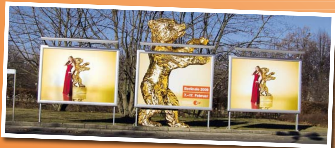
Bärenstarke Werbewirkung zur Berlinale 2008. Durch das Verlängern der Plakatwand nach oben und unten erscheint der Goldene Bär in Übergröße.