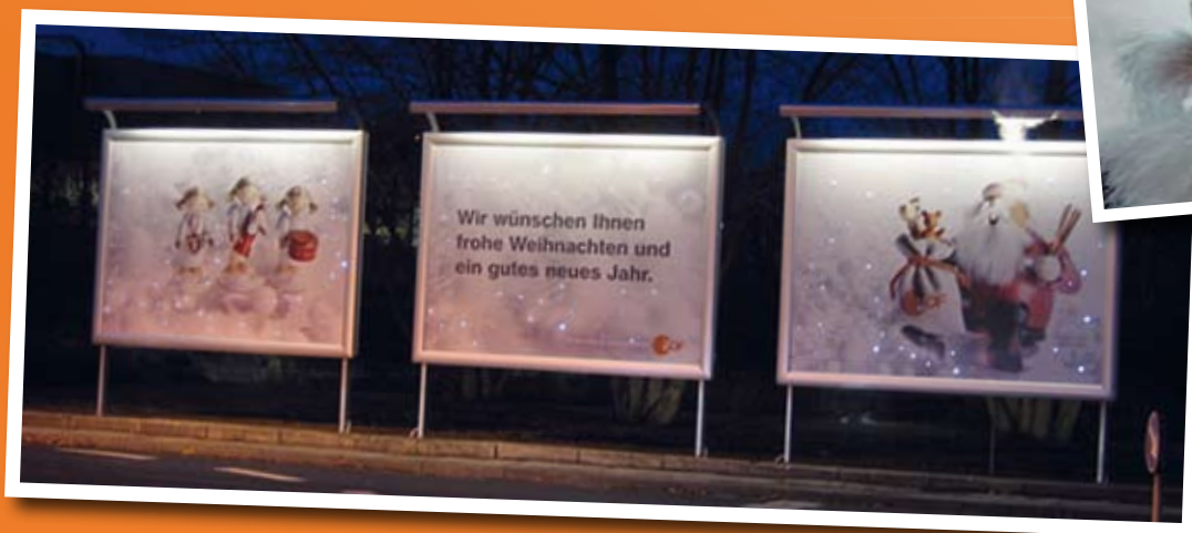
Weihnachtsgrüße der besonderen Art: Eine Nebelmaschine bringt den Räuchermann zum Räuchern und kleine magnetische LED-Lampen verbreiten Lichterglanz.