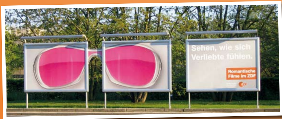
Ein rosaroter Brillensteg verbindet die Plakatwände auf denen die Liebesfilme des Senders angekündigt werden.